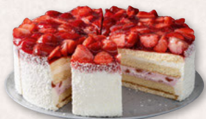
ERDBEER-BUTTERMILCH-TORTE, VORGESCHNITTEN 39000544