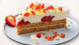
ERDBEER-LEMON-CRUNCHY-ECKE, VORGESCHNITTEN 39000441