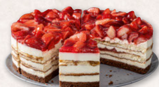
ERDBEER-TIRAMISU-TORTE*, VORGESCHNITTEN 39000750