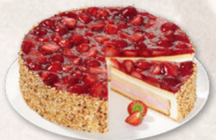
ERDBEER-BUTTERMILCH-TORTE, UNGESCHNITTEN 39000874