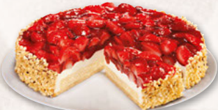
ERDBEERKUCHEN, UNGESCHNITTEN 39000474