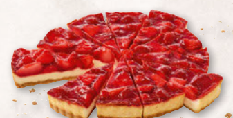
ERDBEER-CHEESECAKE, VORGESCHNITTEN 39000791