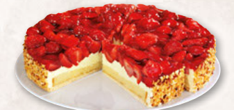
ERDBEERKUCHEN, VORGESCHNITTEN 39000353