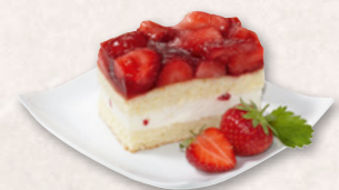
ERDBEER-BUTTERMILCH-SCHNITTE, VORGESCHNITTEN 39000730