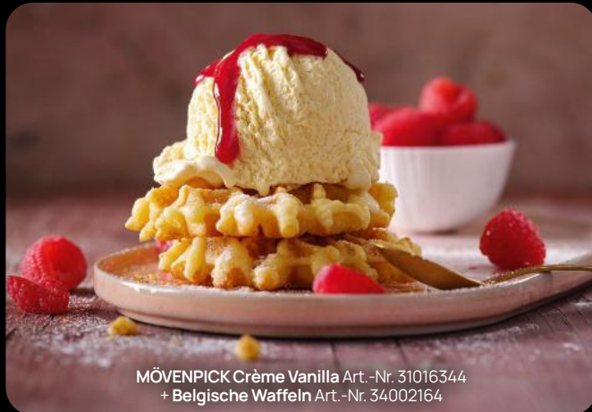
MÖVENPICK Crème Vanilla Art.-Nr. 31016344 + Belgische Waffeln Art.-Nr. 34002164