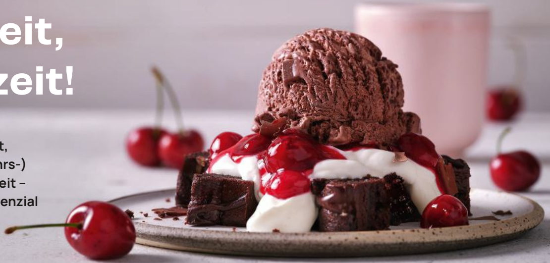
MÖVENPICK Chocolate Chips Art.-Nr. 31026613 + 5

Egal ob klassisches Dessert, festliches Bankett, (Neujahrs-) Empfänge oder zur Kaffeezeit – nutzen Sie das Umsatz-Potenzial der Winterzeit!