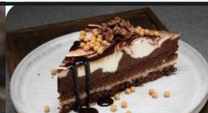
Doppel-Schokomousse-Crispy-Ecke Art.-Nr. 39000495