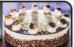
Walnuss-Torte Art.-Nr. 39000477

Unser Sortiment für die kalte Jahreszeit und viele winterliche Rezeptideen gibt's auf froneri-schoeller.de/rezepte