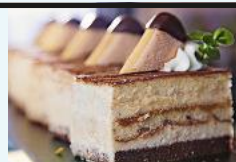
Tiramisu-Schnitte Art.-Nr. 39000636