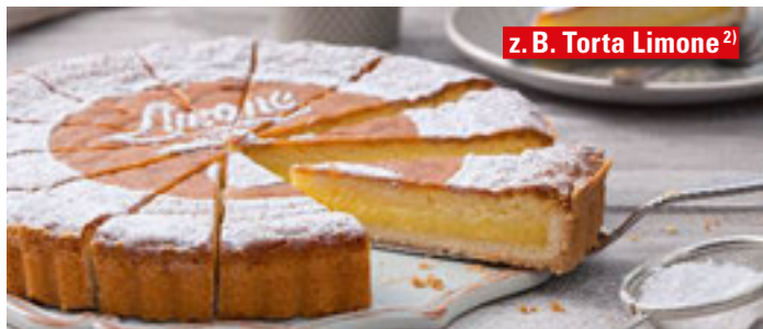
z. B. Torta Limone 2)