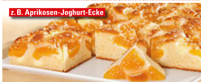
z. B. Aprikosen-Joghurt-Ecke