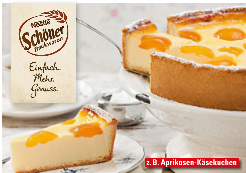
z. B. Aprikosen-Käsekuchen