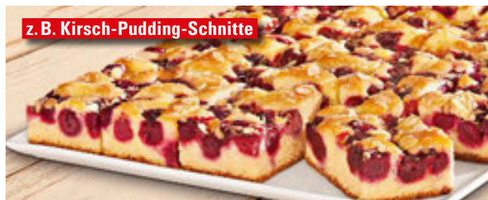
z. B. Kirsch-Pudding-Schnitte