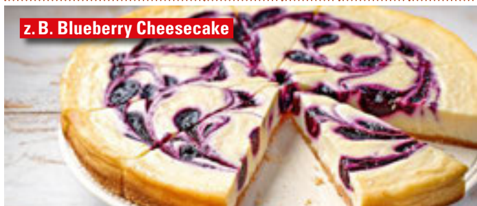
z. B. Blueberry Cheesecake