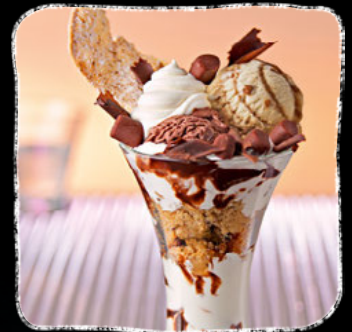
Nuss auf Nuss

Gut aufgestellt für Top-Impulse mit unserer Kommunikation.