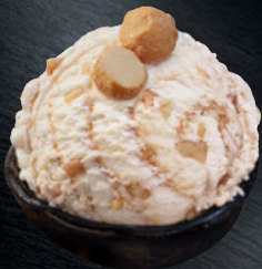
TRES LECHES MACADAMIA

Einzigartige Kombination aus cremigem Eis mit eingedickter entrahmter Milch, Schlagsahne und gezuckerter Kondensmilch, samtiger Karamellsauce und karamellisierten Macadamiastückchen.