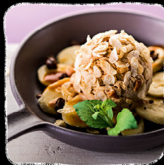
Bananen Split 2.0

MÖVENPICK Caramelita Cream + Bananen + Reisflakes