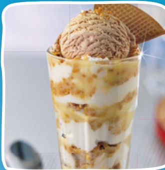
Krokant Art.-Nr. 63241