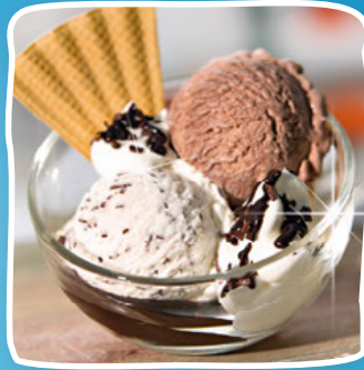
Süßes Duett Art.-Nr. 60565