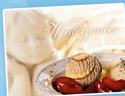
Eiskarte Engelchen Art.-Nr. 90295