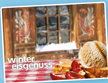
Eiskarte Winter Eisgenuss Art.-Nr. 90286

Lassen Sie sich in die Karten schauen: Top-Impulse mit unseren Werbemitteln!