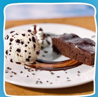
Cookies, Cream & Cake Art.-Nr. 61345