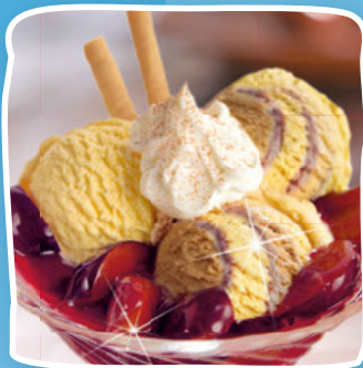
Zimt und Pflaume

Eine leckere Sorte für drei vielseitige Eisbecher: Lassen Sie sich auf www.froneri-schoeller.de inspirieren!