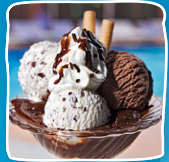
Schokokuss Art.-Nr. 60445