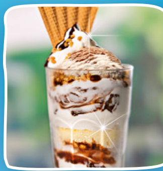
Duo Deluxe Art.-Nr. 61348