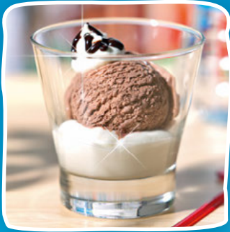
Kleine Leidenschaft Art.-Nr. 60532

Eis-Spaß, ideal für die Winterzeit: Entdecken Sie unsere Eisbecher auf www.froneri-schoeller.de