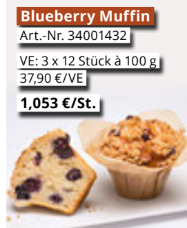
Blueberry Muffin Art.-Nr. 34001432 VE: 3 x 12 Stück à 100 g 37,90 €/VE 1,053 €/St.