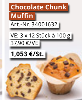
Chocolate Chunk Muffin Art.-Nr. 34001632 VE: 3 x 12 Stück à 100 g 37,90 €/VE 1,053 €/St.