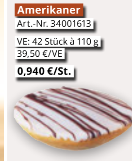
Amerikaner Art.-Nr. 34001613 VE: 42 Stück à 110 g 39,50 €/VE 0,940 €/St.