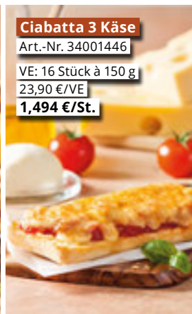
Ciabatta 3 Käse Art.-Nr. 34001446 VE: 16 Stück à 150 g 23,90 €/VE 1,494 €/St.