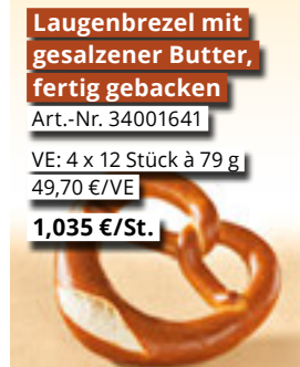
Laugenbrezel mit gesalzener Butter, fertig gebacken Art.-Nr. 34001641 VE: 4 x 12 Stück à 79 g 49,70 €/VE 1,035 €/St.

So sparen Sie einfach Zeit! Produkte, die mit wenigen Handgriffen ruckzuck servierbereit sind, bereichern Ihr Angebot. Gerade auch im Hinblick auf den Take-Away- oder Delivery-Service.