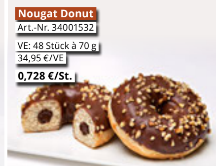
Nougat Donut Art.-Nr. 34001532 VE: 48 Stück à 70 g 34,95 €/VE 0,728 €/St.