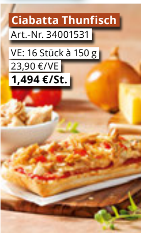
Ciabatta Thunfisch Art.-Nr. 34001531 VE: 16 Stück à 150 g 23,90 €/VE 1,494 €/St.