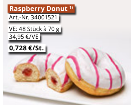
Raspberry Donut 1) Art.-Nr. 34001521 VE: 48 Stück à 70 g 34,95 €/VE 0,728 €/St.