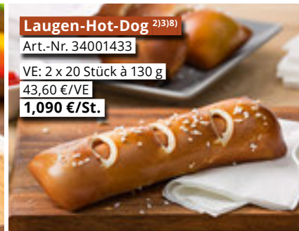
Laugen-Hot-Dog 2)3)8) Art.-Nr. 34001433 VE: 2 x 20 Stück à 130 g 43,60 €/VE 1,090 €/St.