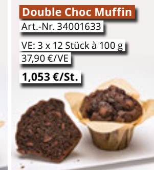
Double Choc Muffin Art.-Nr. 34001633 VE: 3 x 12 Stück à 100 g 37,90 €/VE 1,053 €/St.