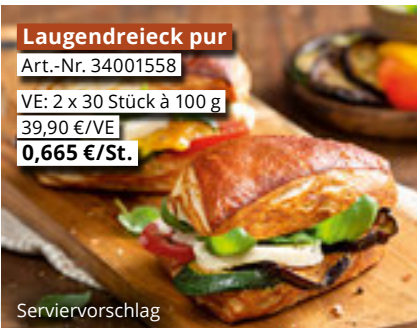
Laugendreieck pur Art.-Nr. 34001558 VE: 2 x 30 Stück à 100 g 39,90 €/VE 0,665 €/St.