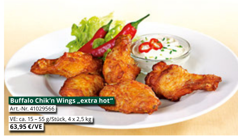
Buffalo Chik'n Wings „extra hot“

Ob Schnitzel, Chik'n Wings oder Hamburger: Darauf sind alle heiß. Nutzen Sie die beliebten Longseller jetzt für sich und lassen Sie das Sommergeschäft entspannt angehen. Wenig Aufwand, große Wirkung!