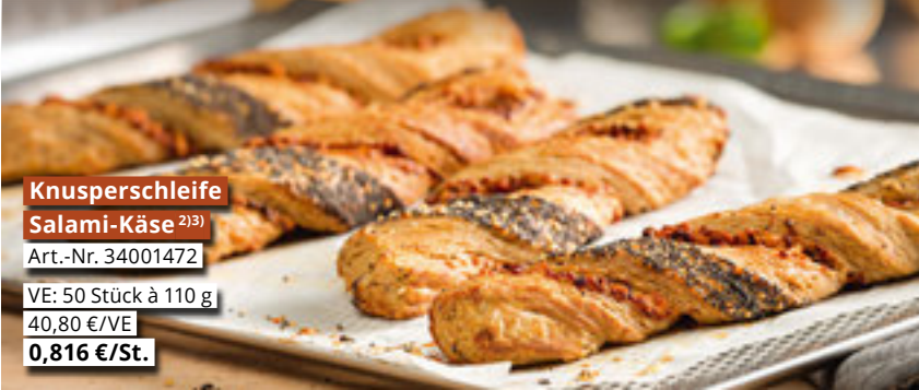
Knusperschleife Salami-Käse 2)3) Art.-Nr. 34001472 VE: 50 Stück à 110 g 40,80 €/VE 0,816 €/St.

Diese pikante Auswahl ist die perfekte Antwort auf den Snack-Hunger Ihrer Gäste! Ideal für zwischendurch und den To-Go-Verzehr. Vorteile für Sie: Alle Snacks sind leicht vorzubereiten und in der Theke platzierbar.