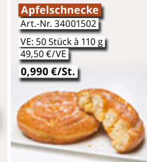
Apfelschnecke Art.-Nr. 34001502 VE: 50 Stück à 110 g 49,50 €/VE 0,990 €/St.