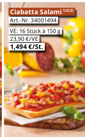
Ciabatta Salami 1)2)3) Art.-Nr. 34001494 VE: 16 Stück à 150 g 23,90 €/VE 1,494 €/St.

Bitte beachten Sie folgende Artikelnummer-Änderungen: