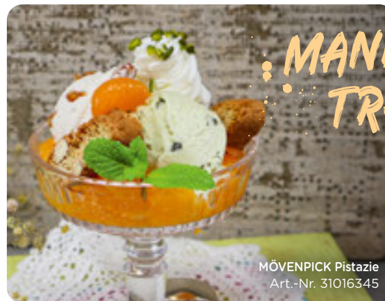
MÖVENPICK Pistazie Art.-Nr. 31016345