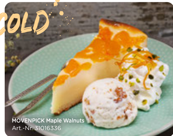
MÖVENPICK Maple Walnuts Art.-Nr. 31016336

Gegensätze ziehen sich an: Unser warmer Mandarinen-Käsekuchen hat sich in eine Kugel MÖVENPICK Maple Walnuts verliebt – das neue Traumpaar auf dem Teller!